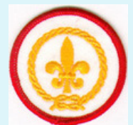
Badges Pionnier et Éclaireur